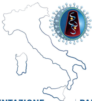
TAVOLA ROTONDA TRA ESPERTI E RAPPRESENTANTI DI SOCIETÀ SCIENTIFICHE SUL TEMA: DAL DECRETO ATTUATIVO SULLO SCREENING ALL'OBIETTIVO FINALE "TO CURE": percorso condiviso e condivisibile a livello Centrale e Regionale

WEBINAR 17 Novembre 2020 DALLE ORE 09.30 ALLE ORE 13.30